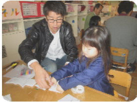
＜昨年度の「お父さんと遊ぼう」の様子＞