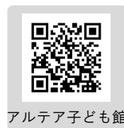
アルテア子ども館

〒400-0805 山梨県甲府市酒折2-12-18 Tel.055-224-1340 Fax.055-224-1993 ※月曜日～金曜日 9:00～17:00 (祝日・休館日を除きます) URL http://www.ygk.ed.jp/altea.html