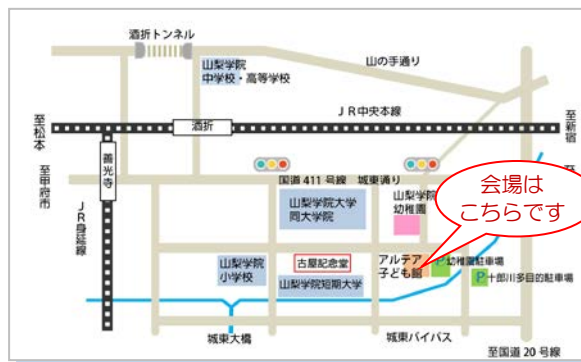
※山梨学院幼稚園駐車場をご利用ください。