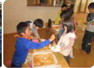
<レストランごっこ>