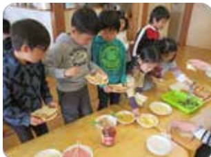
<サンドウィッチパーティー>