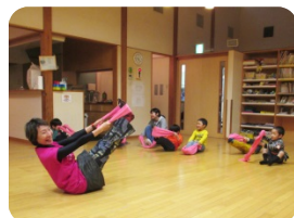
✿大学の先生と遊ぼう✿ 月2回(月曜日)