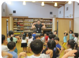
✿英語で遊ぼう✿ 毎週火・金曜日