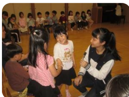
✿中国語で遊ぼう✿ 毎週水曜日