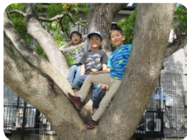
✿好きな遊びをえらんで楽しもう✿毎日