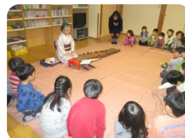
✿おばあちゃんと遊ぼう✿ 月2回(木曜日)