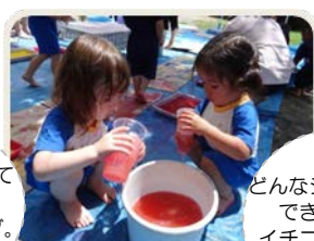
どんなジュースが できるかな イチゴジュース おいしそう