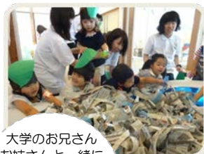
大学のお兄さん お姉さんと一緒に 「あめふりくまのこ」 になりきって お魚さがし。 どこにいるかな