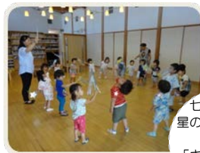
七夕の日。 星のステッキを 持って 「キラキラ星」 を歌いました