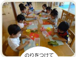
のりをつけて パタパタ ロケットの 七夕飾りを つくりました