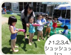
♪1,2,3,4, シュッシュッ シュ