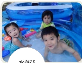
水遊び 気持ちいいね！

いよいよ夏休みに入ります。ご家庭でも、夏ならではの遊びを十分に楽しんでいただきたいと思います。