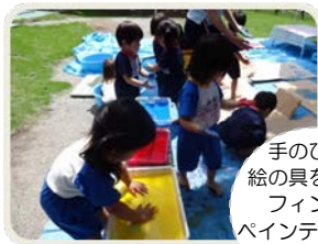
手のひらに 絵の具をつけて フィンガー ペインティング。 楽しいね！