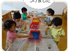
スタンプ遊び。 好きなお魚に うろこを つけました