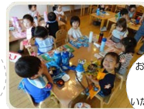
お弁当の日。 みんなで 美味しく いただきました