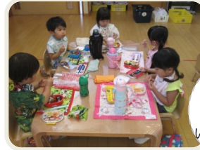
お弁当の日。 みんなで 美味しく いただきました。