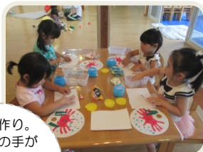
うちわ作り。 みんなの手が カニさんに変身! 泡ブクブク わかめも ユラユラ