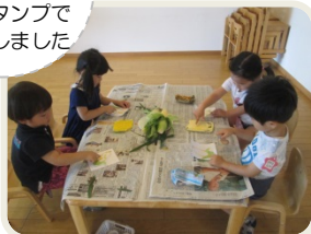
暑中見舞い ハガキ作り。 とうもろこしの粒を 指スタンプで 表現しました