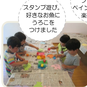
スタンプ遊び。 好きなお魚に うるこを つけました