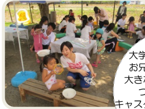
大学のお姉さんや お兄さんと一緒に 大きなシャボン玉を ついたり、 キャスターを引きながら 動物の食べ物探しを したりしました