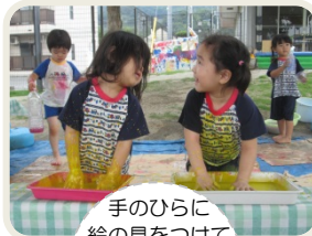
手のひらに 絵の具をつけて フィンガー ペインティング。 楽しいね!