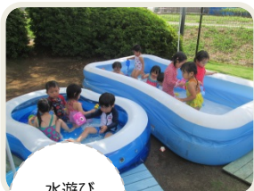
水遊び 気持ちいいね!

いよいよ夏休みに入ります。ご家庭におきましても、夏ならではの遊びを十分に楽しんでいただきたいと思います。