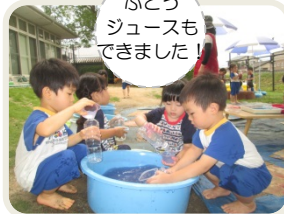
ぶどう ジュースも できました!